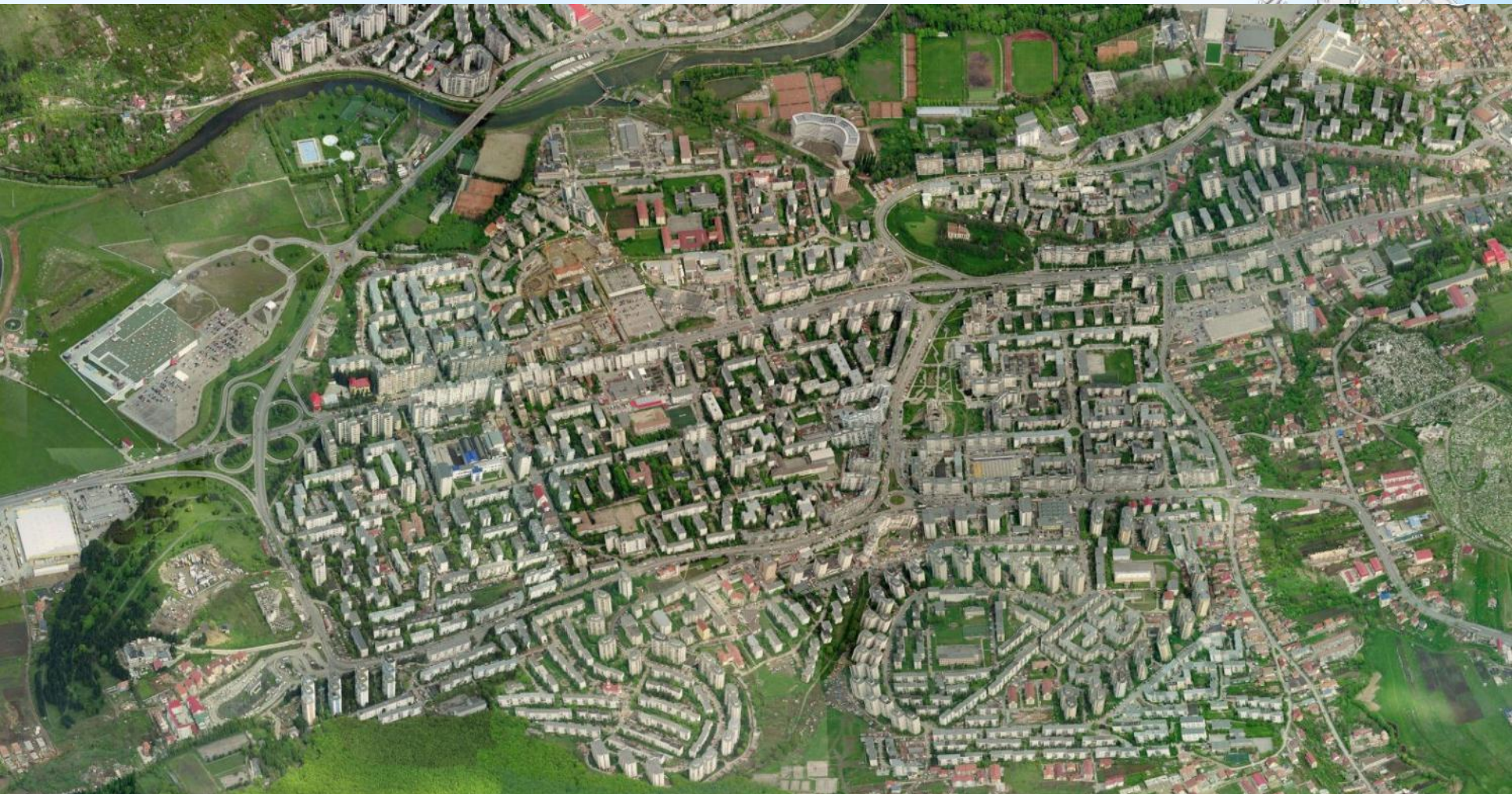
Mănăștur - vedere aeriană